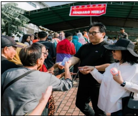
Gambar 3: Antusiasme di sembako murah

Di sisi kanan area pelayanan kesehatan, terdapat stand bazar sembako murah yang menyediakan 1.500 paket sembako berisi beras, minyak goreng, gula pasir, mie instan, dan beberapa kebutuhan pokok lainnya. Harga paket sembako yang ditawarkan jauh di bawah harga pasar. Warga menukarkan kupon di stand registrasi lalu menuju stand sembako untuk mengambil pakatnya. Antrian diatur agar tetap kondusif dengan sistem panggilan nomor urut kupon.