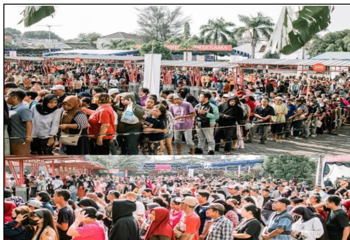
Gambar 7. Antusiasme warga mengikuti Pesta Rakyat di lingkungan GBI MPI Palembang.

Pelaksanaan kegiatan ‘Pesta Rakyat’ yang diadakan oleh Gereja Bethel Indonesia Musi Palem Indah Palembang pada tanggal 19 Oktober 2024 berlangsung dengan sangat meriah dan penuh antusiasme. Antusiasme masyarakat terlihat jelas sejak pagi hari, ditandai dengan keramaian warga yang memadati area gereja dan suasana hangat penuh keakraban di antara warga sekitar.