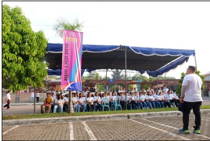
Gambar 1: Briefing panitia sebelum pelaksanaan Pesta Rakyat.

Panggung hiburan diletakkan di halaman utama gereja, sementara stand pelayanan kesehatan, bazar sembako, stand pakaian thrifting , potong rambut gratis, dan permainan anak-anak ditempatkan di area sekelilingnya dengan jalur akses yang saling terhubung. Sebelum kegiatan dimulai, panitia melakukan briefing bersama untuk memastikan seluruh personel memahami tugas dan alur kegiatan. Dokumentasi kegiatan dimulai sejak tahap persiapan ini untuk memastikan seluruh proses terdokumentasikan dengan baik.