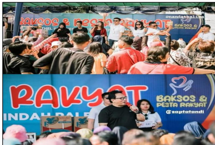
Gambar 6: Suasana panggung hiburan dan pembagian door prize Pesta Rakyat

Suasana kegiatan semakin meriah dengan hiburan musik yang dihadirkan sepanjang acara. Panggung utama diisi oleh pertunjukan organ tunggal, penampilan vokal jemaat, lomba karaoke warga, dan berbagai kuis berhadiah. Puncak acara ditandai dengan pembagian door prize berupa barang-barang elektronik, peralatan dapur, dan paket sembako tambahan. Door prize ini diundi menggunakan nomor seri yang tertera di kupon layanan warga.