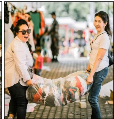
Gambar 4 & 5: Stand thrifting pakaian layak pakai

Bersebelahan dengan bazar sembako, terdapat stand pakaian thrifting yang menyediakan lebih dari 1.000 potong pakaian layak pakai yang dijual dengan harga Rp5.000 hingga Rp10.000 per potong. Stand ini menjadi salah satu lokasi yang paling ramai dikunjungi karena harga yang sangat terjangkau. Tidak jauh dari situ, stand potong rambut gratis untuk anak-anak dan remaja dibuka sejak pukul 08.30 WIB dan berhasil melayani 60