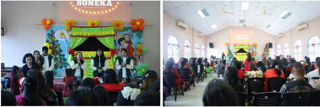
Gambar 2. Penyampaian cerita Natal menggunakan media panggung boneka sebagai sarana edukasi nilai Kristiani bagi anak usia dini di TK Teramian Batam.

Hasil observasi menunjukkan bahwa penggunaan media panggung boneka membantu mempertahankan fokus anak selama kegiatan berlangsung. Sebagian besar anak tetap memperhatikan pertunjukan hingga sesi cerita selesai dan menunjukkan respons spontan terhadap dialog yang dimainkan tokoh boneka. Anak-anak tampak mengikuti alur cerita dengan memperhatikan gerakan tokoh, menirukan beberapa ungkapan sederhana, serta tertawa dan memberikan respons ketika terjadi interaksi antara pemeran dan tokoh boneka. Situasi tersebut memperlihatkan bahwa media visual-interaktif membantu anak usia dini lebih mudah mempertahankan perhatian dibandingkan penyampaian materi secara verbal semata. Temuan ini sejalan dengan pandangan bahwa anak usia dini cenderung memperoleh pemahaman melalui pengalaman yang bersifat langsung dan nyata, karena kemampuan berpikir abstrak mereka belum berkembang secara optimal (Santrock, 2020). Dalam pendidikan anak usia dini, media visual dan cerita membantu anak membangun pemahaman melalui pengalaman yang dekat dengan dunia mereka (Sidiq et al., 2025).