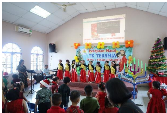
Gambar 2: Penampilan tarian pembukaan oleh anak-anak TK Teramian Batam dalam perayaan Natal bertema “Yesus Idolaku.”

Pelaksanaan kegiatan diawali dengan penampilan tarian sederhana dari anak-anak sebagai bentuk ekspresi sukacita dalam menyambut perayaan Natal. Penampilan tersebut membantu menciptakan suasana yang hangat, menyenangkan, dan penuh antusiasme sebelum memasuki rangkaian kegiatan inti. Dalam konteks pendidikan anak usia dini, aktivitas seni dan gerak seperti tarian dapat membantu membangun keterlibatan emosional anak serta menciptakan suasana belajar yang lebih aktif dan komunikatif.