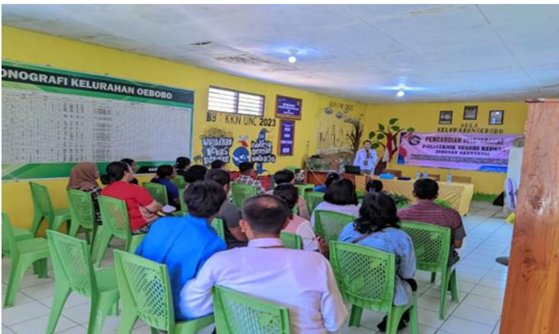
Gambar 3. Demonstrasi Adopsi Aplikasi SIAPIK

Keberhasilan integrasi teknologi dalam program akselerasi dasar ini dievaluasi melalui persepsi kemudahan penggunaan yang menjadi inti dari pendekatan TAM. Secara historis, kecemasan teknologi dan kerumitan logika akuntansi konvensional (debit-kredit) merupakan justifikasi utama keengganan pelaku usaha mikro dalam mengadopsi sistem pembukuan digital. Hasil pendampingan adopsi aplikasi SIAPIK menunjukkan bahwa arsitektur sistem SIAPIK secara efektif mengeliminasi hambatan tersebut. Melalui demonstrasi visual terpusat, para perajin tenun menunjukkan tingkat penerimaan yang tinggi terhadap tampilan aplikasi. Ketiadaan kebutuhan untuk menyusun jurnal entri ganda secara manual membuat proses adaptasi profil entitas bisnis, hingga input transaksi bahan baku dan beban operasional, dapat diinternalisasi dengan cepat oleh perajin, terlepas dari keragaman latar belakang literasi digital mereka. Reaksi positif dari para perajin ditandai dengan peserta yang menganggap teknologi ini mudah dipahami sehingga memotivasi mereka untuk mengadopsi aplikasi tersebut sesuai dengan kerangka Model Penerimaan Teknologi (TAM) yang dikembangkan oleh (Davis, 1987). Didukung oleh penelitian (Pane & Pratiwi, 2026) terkait penilaian kelayakan aplikasi SIAPIK yang mengelaborasi kelayakan aplikasi menggunakan metode TELOS yang menerangkan bahwa aplikasi SIAPIK memenuhi kriteria kelayakan teknis, ekonomi, hukum dan kepatuhan, operasional, serta jadwal.