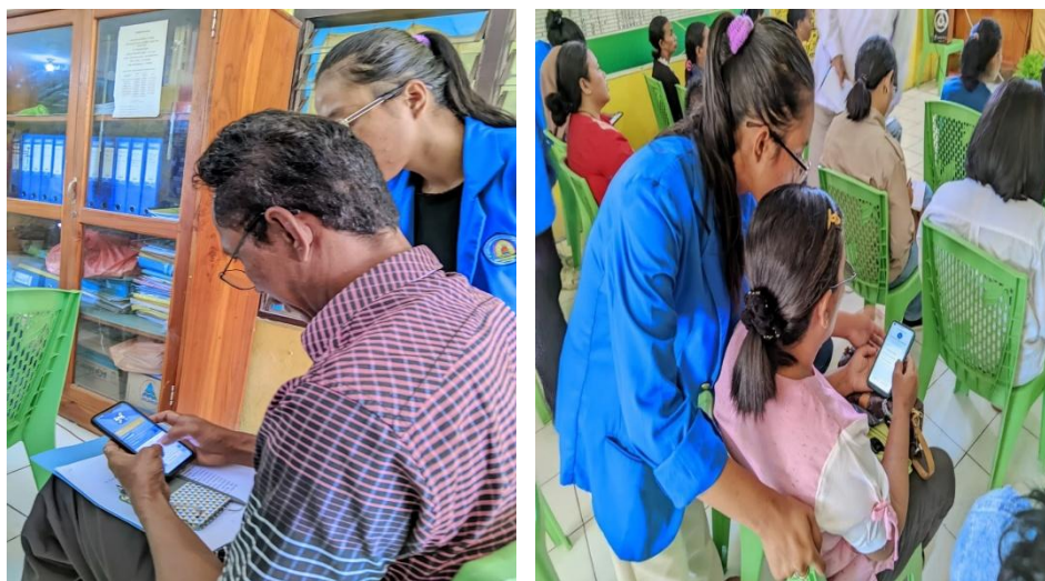
Gambar 5. Pendampingan Uji Coba Langsung

Meskipun pendampingan ini dilaksanakan dalam satu hari, tujuan jangka pendek spesifik dari program ini telah berhasil tercapai. UMKM tenun di Kelurahan Oebobo memperoleh literasi keuangan teoretis serta kemampuan teknis untuk mengelola SIAPIK. Tindakan ini menunjukkan bahwa hambatan utama dalam digitalisasi UMKM bukanlah ketidaksukaan terhadap teknologi, melainkan kurangnya mekanisme dukungan yang adaptif, partisipatif, dan berkelanjutan yang dapat diakses. Program ini secara efektif berfungsi sebagai katalis awal, meningkatkan pemahaman tentang tata kelola administratif di kalangan perajin tenun yang diharapkan dapat meningkatkan daya saing produk lokal dan memfasilitasi akses pembiayaan modal bagi para perajin di masa depan.