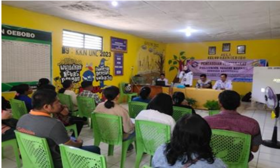
Gambar 2. Sosialisasi dan Edukasi Literasi Keuangan