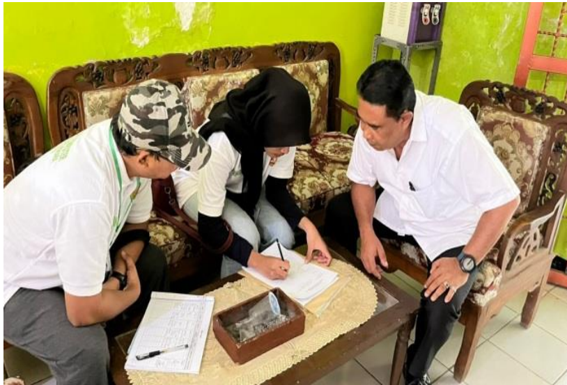
Gambar 2: Melakukan Wawancara dengan Petugas Desa Sekarwangi