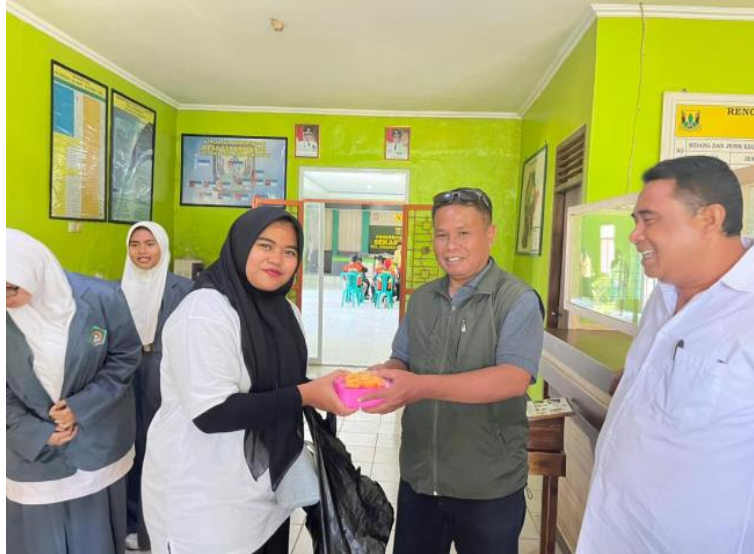
Gambar 3: Mitigasi dan Penyerahan Cindramata