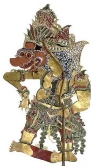
Gambar 2: Bethara Kala

Tradisi ruwatan masih ada hingga saat ini bukan hanya di wilayah Kudus, namun di seluruh wilayah Jawa. Setiap pengruwat dalam konteks dalang biasanya berbeda-beda. Orang yang memimpin tradisi ruwatan disebut pengruwat (Muhammad bahrudin, 2019). Ada dalang yang berani mengruwat ketika sudah mempunyai cucu, ada dalang yang berani mengruwat setelah mempunyai menantu, ada dalang yang berani mengruwat ketika telah mempunyai keluarga, ada dalang yang berani mengruwat ketika orang tertua di silsilah keluarganya sudah tiada, dan ada juga dalang yang berani mengruwat setelah melewati pengesahan.